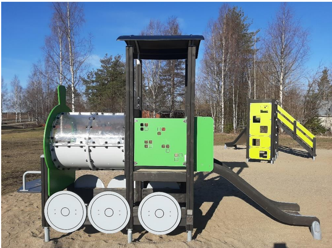
Kuvailu: kuva Sukevan leikkikentältä, jossa kiipeilyteline ja junan mallinen liukumäki